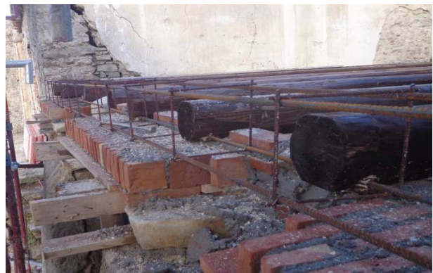
Figg. 4 - Inserimento di cordoli armati; l’orditura primaria viene opportunamente ancorata ai setti portanti fungendo da catene/tiranti