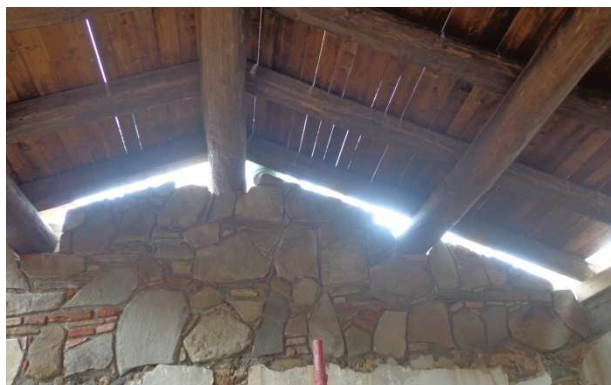
Figg. 5 - Passaggio da sistema spingente a sistema poggiate