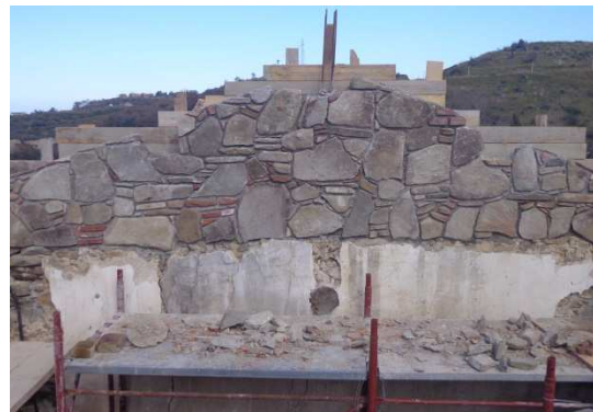
Figg. 3 - Tecnica dello “Scuci e Cuci” e dell’ “Anastilosi” per il ripristino di lesioni passanti; rifacimento della muratura portante originaria