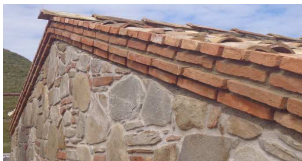
Figg. 2 - Cotto usato nella realizzazione del manto di copertura e della pavimentazione del C.I.T.